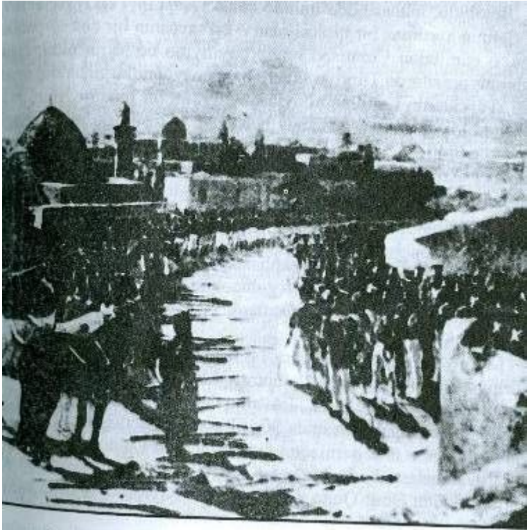
Rus ordusunun İrəvanı işğal etməsi (1827). Rəssam Rubo.